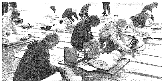
応急手当訓練の様子

西地域防災訓練を、佐倉地区町会連と合同で実施しています。令和5年度からはコロナ禍以前の実施内容に戻し、多くの方に参加してもらえるよう消火や救出・搬送・応急手当訓練に加え、AEDの展示、煙体験訓練など地区で訓練メニューを検討しながら実施しています。