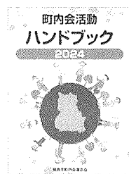
町内会活動ハンドブック

多岐にわたる町内会活動を円滑に進めるためのマニュアルとして、ご活用ください。(同じQRコードからダウンロードが可能です。)