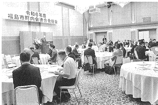
ホテル福島グリーンパレスで開催した令和6年度総会の様子

なお、今年度は7名が新たに地区町内会連合会長に就任されました。(4ページ記載の「令和6年度福島市町内会連合会名簿」をご参照ください。)