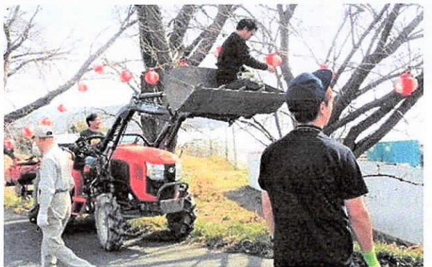
【トラクターで安全に提灯を取り付ける】