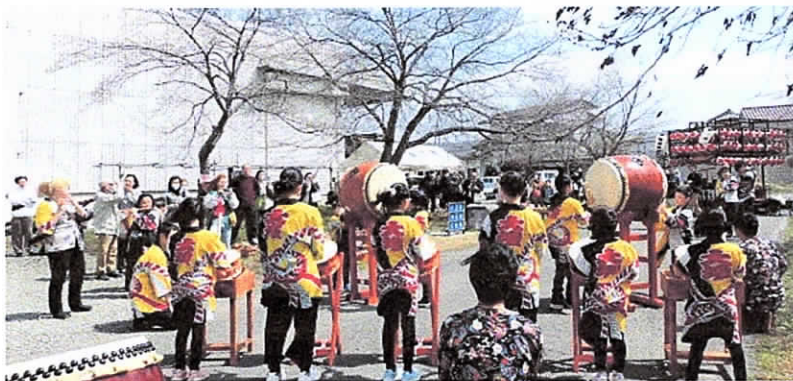
【オープニングセレモニーで太鼓演奏する桜鼓会の子どもさん】

また、町内の皆様から寄贈いただいた鯉のぼりが青空に映え、春風をいっぱい吸い込んで泳ぐ姿が綺麗でした。