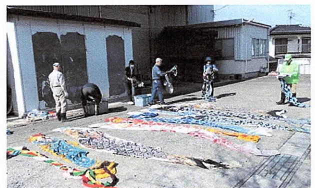
【鯉のぼりの点検作業】