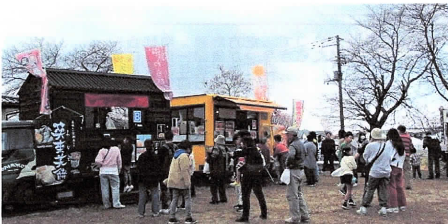
【3台のキッチンカーが並び、沢山の方に利用していただいた】