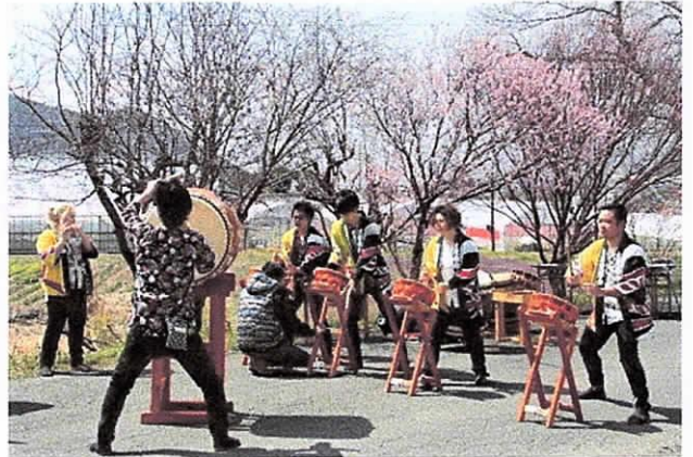
【大旦町会「桜鼓会」の演奏にも熱が入る】