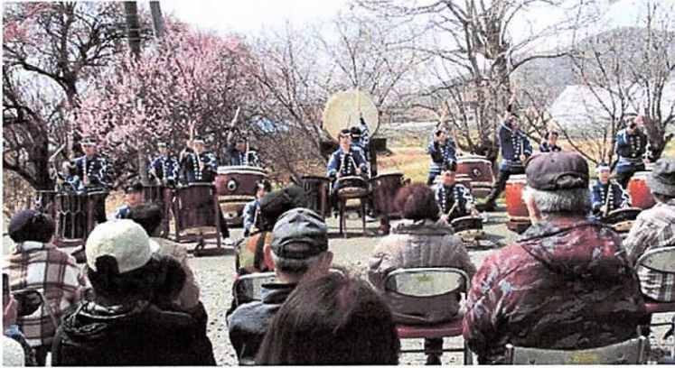
【結成後20数年の歴史を物語るような迫力ある演奏】