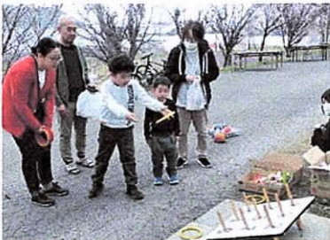
【子ども達に輪投げやストラックアウトゲームを用意】