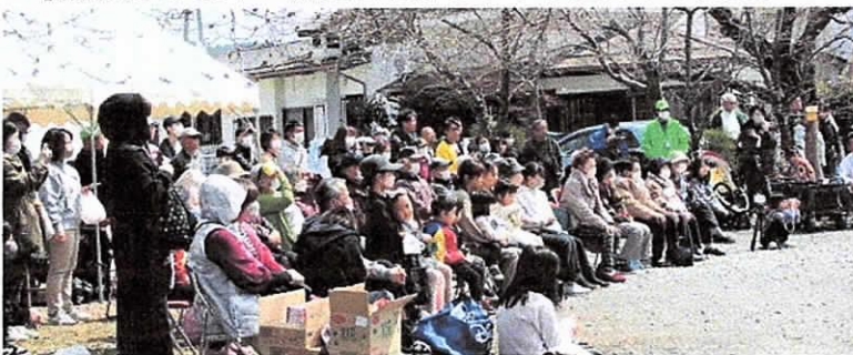
【広く名が知られており沢山の方が来てくれた】

成功の陰に裏方さんあり。目には見えませんが、祭りの成功に向け、頑張ってくださいました。