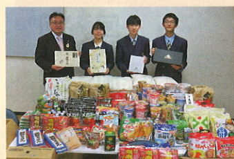
福島北ロータリークラブ・ 学法福島高等学校 インターアクトクラブ 様