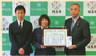
福島ヤクルト販売 様 福島ヤクルトYL親交会 様