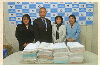
福島法人会女性部会 様 タオル 760枚