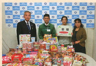
コープふくしま新町店 様