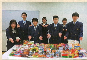
学法福島高等学校JRC 様