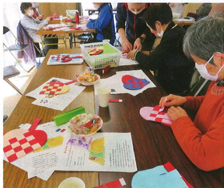
【ハートバッグ製作】

毎月第2火曜日、福島県復興公営住宅「北沢又団地集会所」において、北沢又団地入居者及び北沢又団地周辺の地域住民を対象にした“居場所”を開催しています。この“居場所”では、レクリエーション、脳トレ、ボードゲーム等の卓上でできるゲーム、参加者同士の歓談などを通して、参加者が人とつながりながら、思い思いに自由に過ごせる時間と場所を目指しています。飲み物や茶菓子もあり、誰でも参加しやすい雰囲気になっていますので、対象住民の方々の参加をお待ちしています！