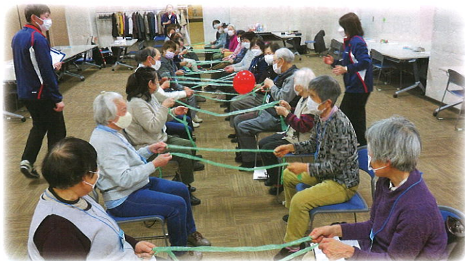
「わくわく☆レクリエーション」

毎月1回第4水曜日、避難されている方々の集う場づくりとコミュニティづくりの推進を目的とした交流事業を開催しています。レクリエーションや製作活動など参加者同士が楽しみながらコミュニケーションを深める機会となっています。