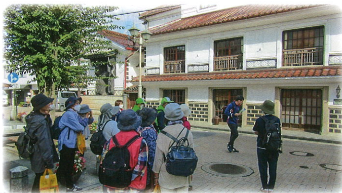
健康と生きがいづくり「まち歩き」

「誰でも気軽に」「出入り自由」「好きなこと・やりたいことを楽しむ」をコンセプトに「居場所」始めました!!