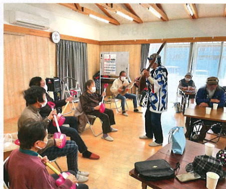
【スコープ三味線演奏会】