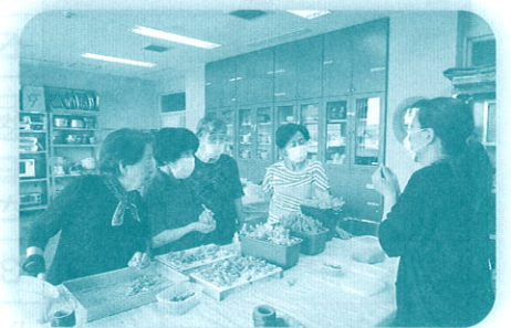
みどりの広場 (多肉植物の寄せ植え)