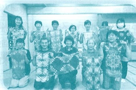
ゆうがお(染色：シルクストール)