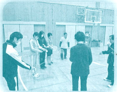
市民学校 (バドミントン教室)