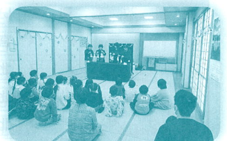
おななしのとびら