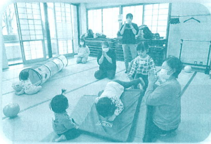
ほくしんキッズクラブ (親子体操)