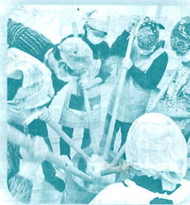
冬休み子ども企画 (お餅料理：餅つき)