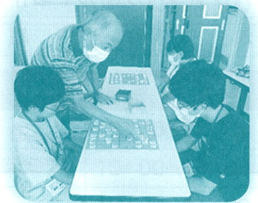
北信ジュニア将棋教室 (みんなでの対局)