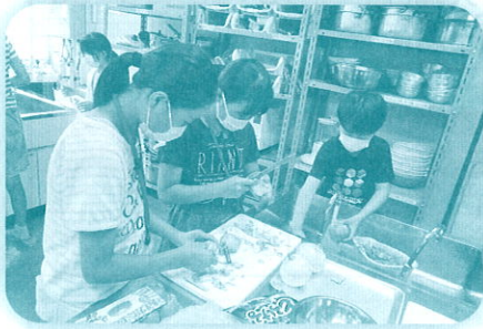
北信リーダー教室 (宿泊学習：カレーづくり)