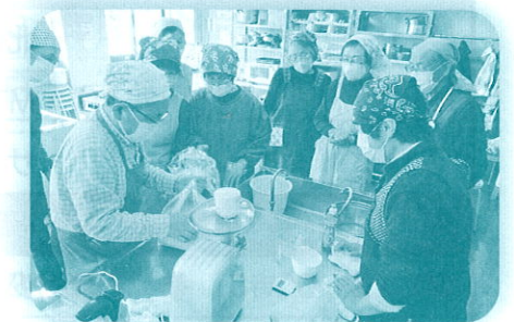
ほくしん学びカレッジ (味噌づくり)