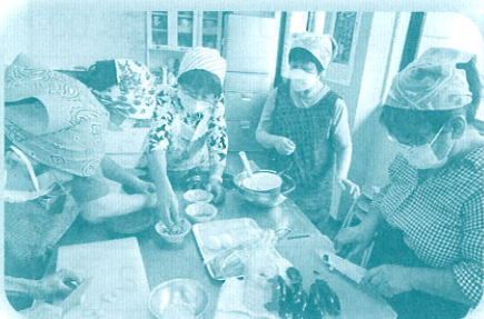
ふれあい(料理教室：旬の野菜)