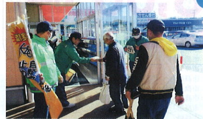
12月17日マルト窪田店での防犯パレードの実施状況

勿来防犯協会は、昭和52年9月に発足し、現在84名の会員で構成され、地域の安全と平穏を守るための各種活動を実施しています。犯罪のない街づくりや少年の健全育成のため、年間を通じた青色回転灯装備車両での巡回パトロールの他、関係機関と連携したなりすまし詐欺被害防止の街頭キャンペーン、さらには、地域住民の防犯意識の高揚のための立て看板の設置等を行い、様々な活動を通して、安全・安心のための地域づくりに積極的に貢献しています。