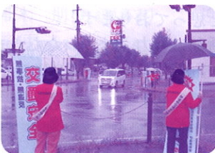
【伊達市交通安全母の会】 R5.10.15

今後も交通安全母の会の基本理念である「交通安全は家庭から」、「命大切に」をスローガンに、悲惨な交通事故を一件でもなくするため、母親の立場で地域に根ざした活動を継続していきましょう。