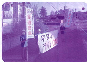
【泉崎村交通安全母の会】 R5.10.11