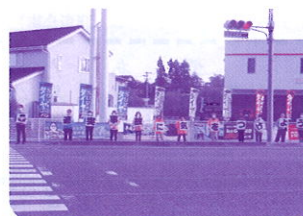
【白河市交通安全母の会】 R5.10.12