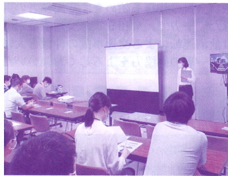
歩行者シュミレータ