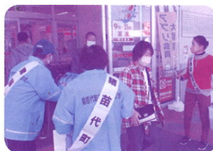
【猪苗代町交通安全母の会】 R5.10.14