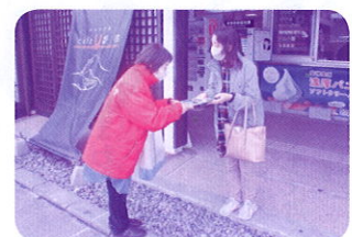
【磐梯町交通安全母の会】 R5.10.21