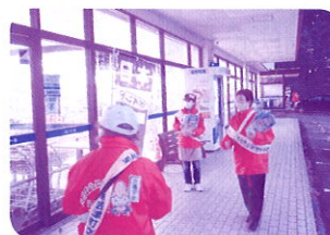
【西会津町交通安全母の会】 R5.10.15