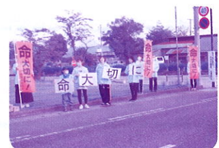
【桑折町交通安全母の会】 R5.10.13