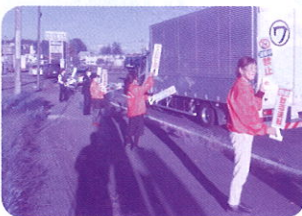
【矢吹町交通安全母の会】 R5.10.12