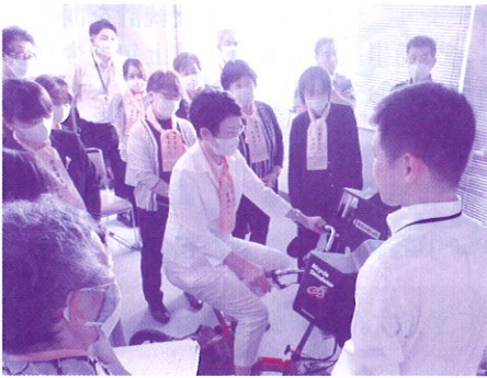
自転車シュミレータ