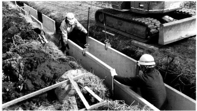
■水路への側溝敷設の様子

より良いまちづくりを進めるために、地区の皆さんが身近な課題について協議・提案によって、地区の皆さんの意見が行政に反映されています。