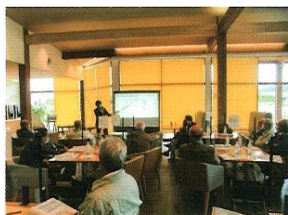
市政研修会 道の駅ふくしま (令和4年10月12日開催)

機関誌「広報いちしん」の発行や、各地区会長による「会長会議」の実施及び「市政研修会」、「優良都市視察研修」などの研修を実施しています。