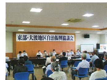
東部・大波地区自治振興協議会 (令和4年8月29日開催)

分権型社会への移行と市民のまちづくり意識の高まりにより、地区自治振興協議会は「地域のまちづくり」に取り組む中心的組織として大きな役割を担っています。