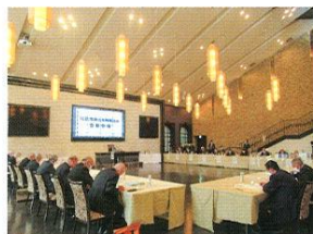
会長会議 (令和4年11月18日開催)