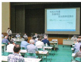
吾妻地区自治振興協議会 (令和4年6月28日開催)

市内28地区に自治振興協議会が組織され、地区の協議テーマや提案事項などの取りまとめ、本開催の運営などにあたっています。