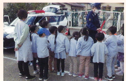
園児による交番見学