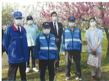
飯坂地区合同補導