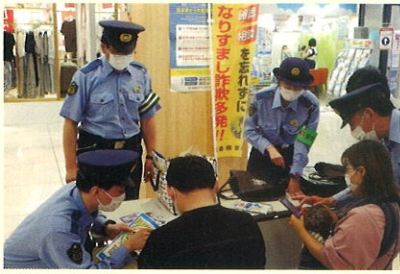
POLICEメールふくしま登録促進活動