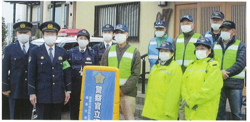
警察官立寄所開所式 (原田集会所)