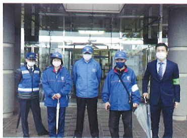
信陵方部街頭補導活動