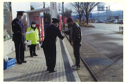
年金支給日における広報活動