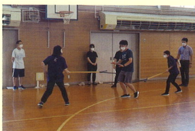
学校における不審者侵入対応訓練