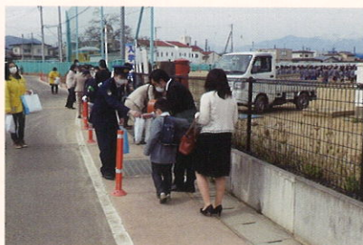
新入学児童に対する防犯広報活動