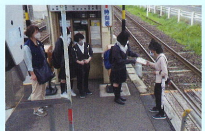
地域安全ヤングボランティア「ノースエンジェルス(福島北高等学校)」による広報活動