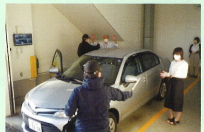
金融機関模擬強盗訓練