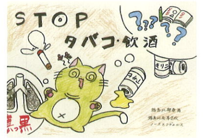
地域安全ヤングボランティア(ノースフェリス福島校)作成ポスター