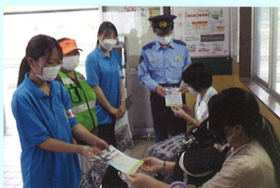
地域安全ヤングボランティア「ノースエンジェルス(福島学院大学)」による広報活動