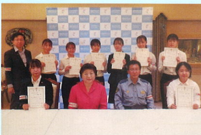
地域安全ヤングボランティア「ノースエンジェルス」委嘱状交付