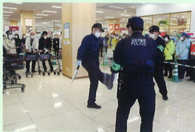
大型商業施設における不審者侵入対応訓練