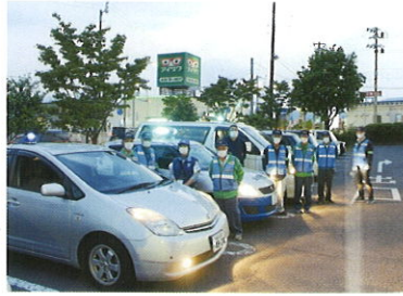
北信方部合同パトロール