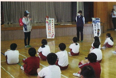
少年警察ボランティアによる声掛け被害防止寸劇