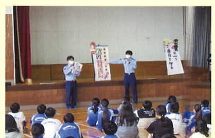
小学校における防犯教室