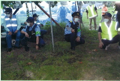
果樹盗難被害防止パトロール