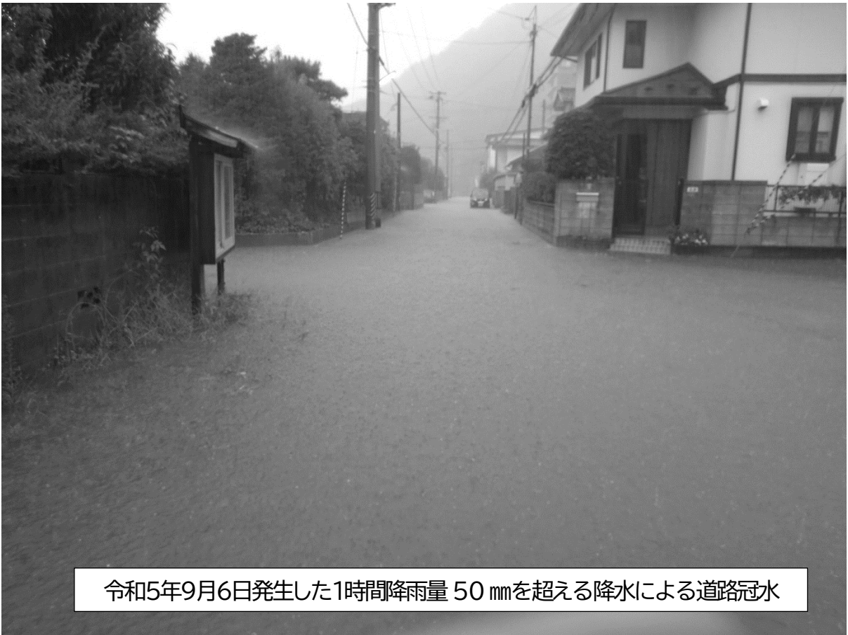
令和5年9月6日発生した1時間降雨量 50 mmを超える降水による道路冠水