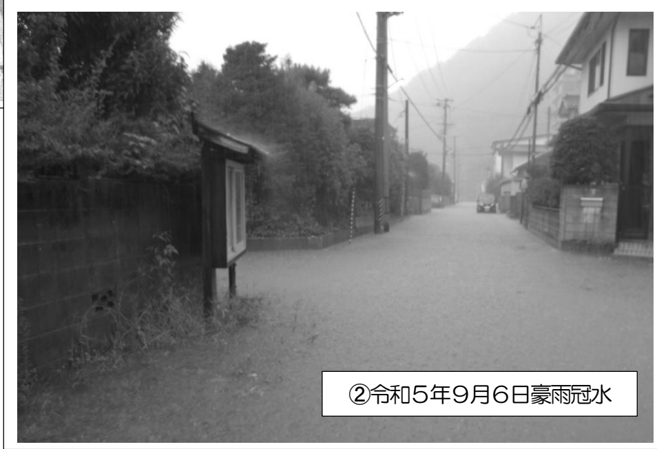
②令和5年9月6日豪雨冠水