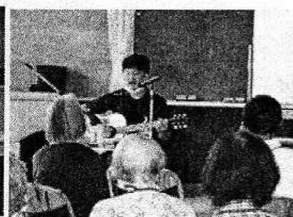
【銀の森治療院長講演】