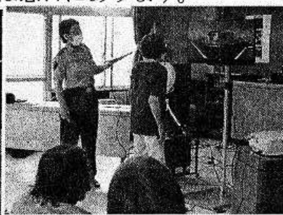
【高齢者交通安全教室】