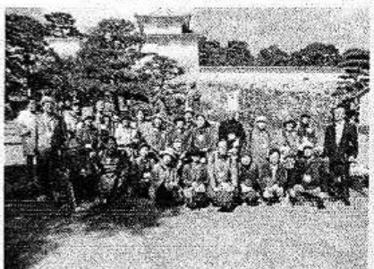
【二本松へ研修旅行】