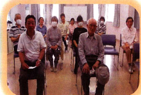
【すかわももりん体操】