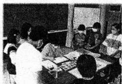
パステルアート教室