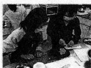
クリスマスパーティー